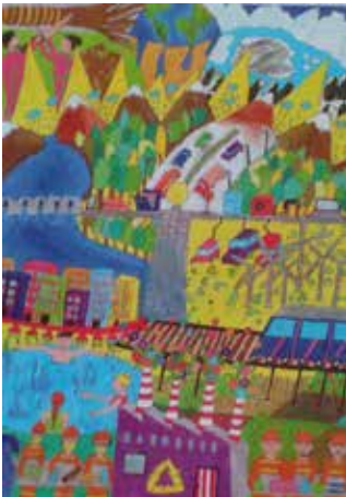
8-D Beyza Nur YENİCE